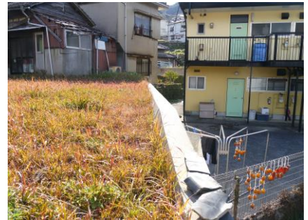
③ 空き地 フェンスがなく危険