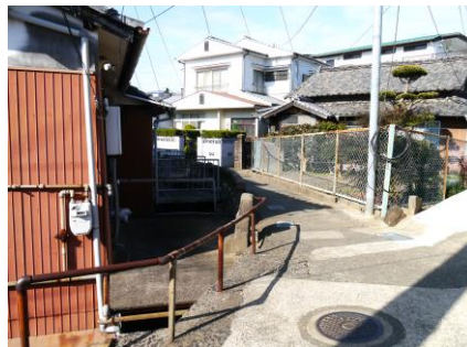
⑤ 石の柵が低く転落注意