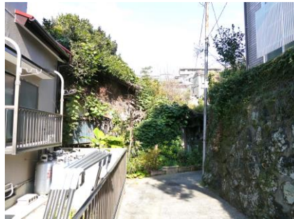
② 空き家 倒壊の危険