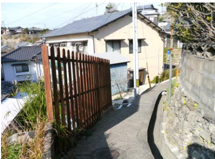
④ 道がせまく溝蓋がないので注意