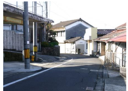
⑥ カーブで見通しが悪い