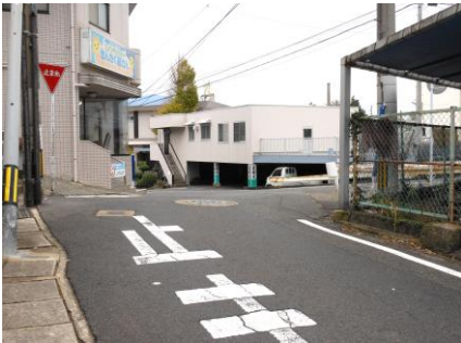
① 見通しが悪い 下りの車のスピードに注意