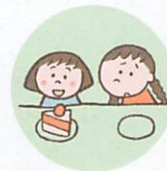
他のきょうだいとは著しく差別的な扱いをすること