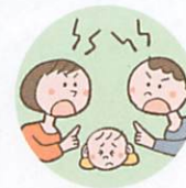
配偶者への暴力や暴言をこどもに見せること