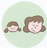
こどもを無視したり、拒否的な態度を示すこと