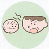
言葉で脅したり、脅迫すること

体罰は暴力でこどもの身体を傷つけるもので、心理的虐待は暴言などでこどもの心に深い傷を負わせるものです。こども本人への暴言でなくとも、配偶者や家族に対する強い言葉などもこどもの心を傷つけ、発達に影響する可能性があります。